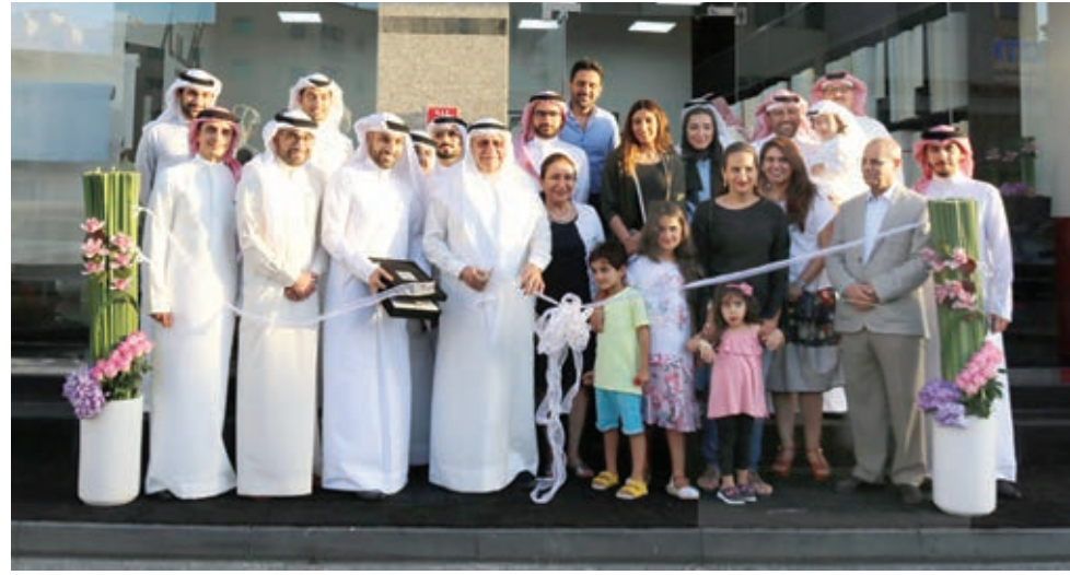
ثقلة نوعية في السوق البحريني من خلال منافسة أكبر دور الأزياء الرجالية. وتوسعي «هيبة» إلى تحقيق المصانع الآسيوية والأوروبية والخليجية في مجال الأقمشة

والخياطة في المملكة عبر توسيع الخدمات، واعتماد خطة الانتشار والتوسع خلال الخمس سنوات القادمة لتشمل كافة المحافظات الأربع والانتقال من السوق المحلي إلى المحيط الخليجي. وقد أشاد حاضرون حفل الافتتاح بجودة المعروضات في المحل، مؤكدين على ريادة سوق البحرين في المنافسة وخاصة في مجال الأزياء الرجالية، نظراً إلى كونه من أوائل الأسواق في محيطنا الخليجي، كما نوه الحضور بدخول الشباب البحريني مجال ريادة الأعمال واستقطاب العديد من الشركات والأسماء الأجنبية والخليجية الالامعة في هذا المجال.